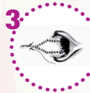
3 Il flap cutaneo viene fatto scivolare fino a ricoprire la ragade.