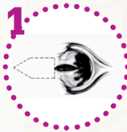
1 Incisione della cute perianale e preparazione del flap

Quando vi è un restringimento dell'orifizio anale quale conseguenza di intervento tradizionale per emorroidi, o quale conseguenza di infiammazioni croniche, la cura più appropriata è la terapia chirurgica. L'intervento consiste nel fare una plastica del canale anale per correggere la stenosi e contemporaneamente ricoprire la ragade con pelle normale. Questi interventi devono essere fatti da coloproctologi con esperienza perché risultano semplici se ben condotti. Si tratta di fare