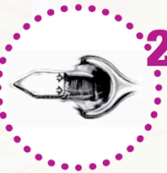
2 Escissione della ragade